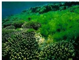
3) Морские водоросли

Запиши цифры, которыми обозначены морские организмы, в клеточки в нужной последовательности.