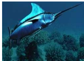
2) Рыба меч