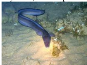
1) Морской угорь