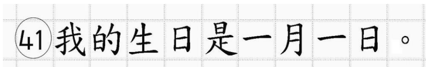
Рис.16. Образец написания иероглифических знаков

Бланк ответов № 2 (лист 1 и лист 2) по китайскому языку (рис. 14 и рис. 15) предназначен для записи ответов на задания КИМ для проведения ЕГЭ с развернутым ответом по китайскому языку (строго в соответствии с требованиями инструкции к КИМ для проведения ЕГЭ и к отдельным заданиям КИМ). Каждый иероглифический знак и каждый знак препинания следует писать внутри отдельной клетки в поле ответов бланка ответов № 2 (дополнительного бланка ответов № 2) (рис. 16).